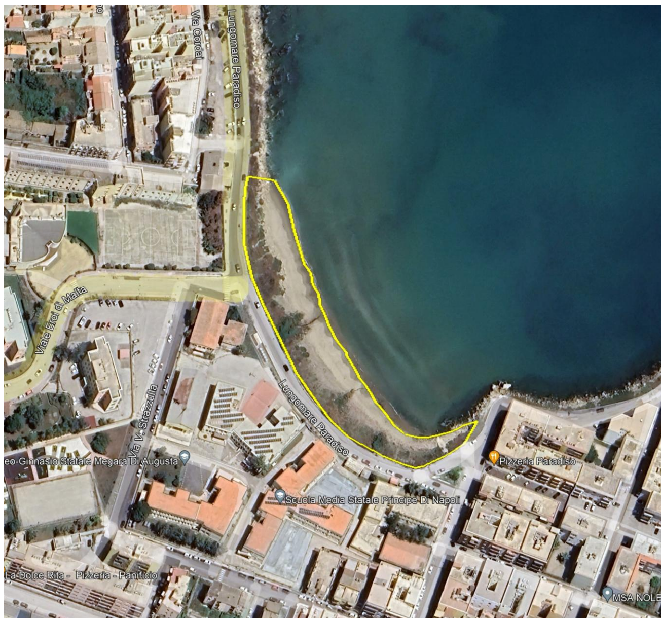
Fig. 2 – Spiaggia del Lungomare Paradiso

VII SETTORE – SERVIZI PER LA TRANSIZIONE ECOLOGICA E DIGITALE E PER LA PROTEZIONE CIVILE