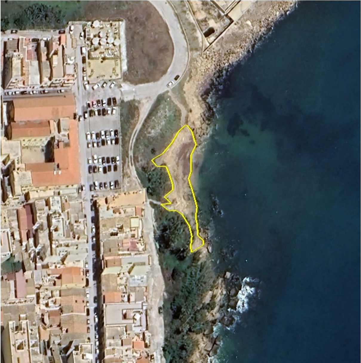
Fig. 4 – Spiaggetta delle Grazie

VII SETTORE – SERVIZI PER LA TRANSIZIONE ECOLOGICA E DIGITALE E PER LA PROTEZIONE CIVILE