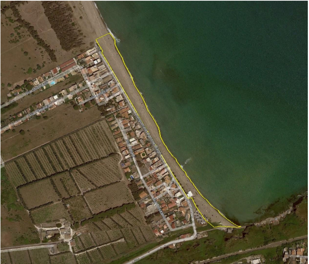
Fig. 1 – Spiaggia di Agnone Bagni

VII SETTORE – SERVIZI PER LA TRANSIZIONE ECOLOGICA E DIGITALE E PER LA PROTEZIONE CIVILE