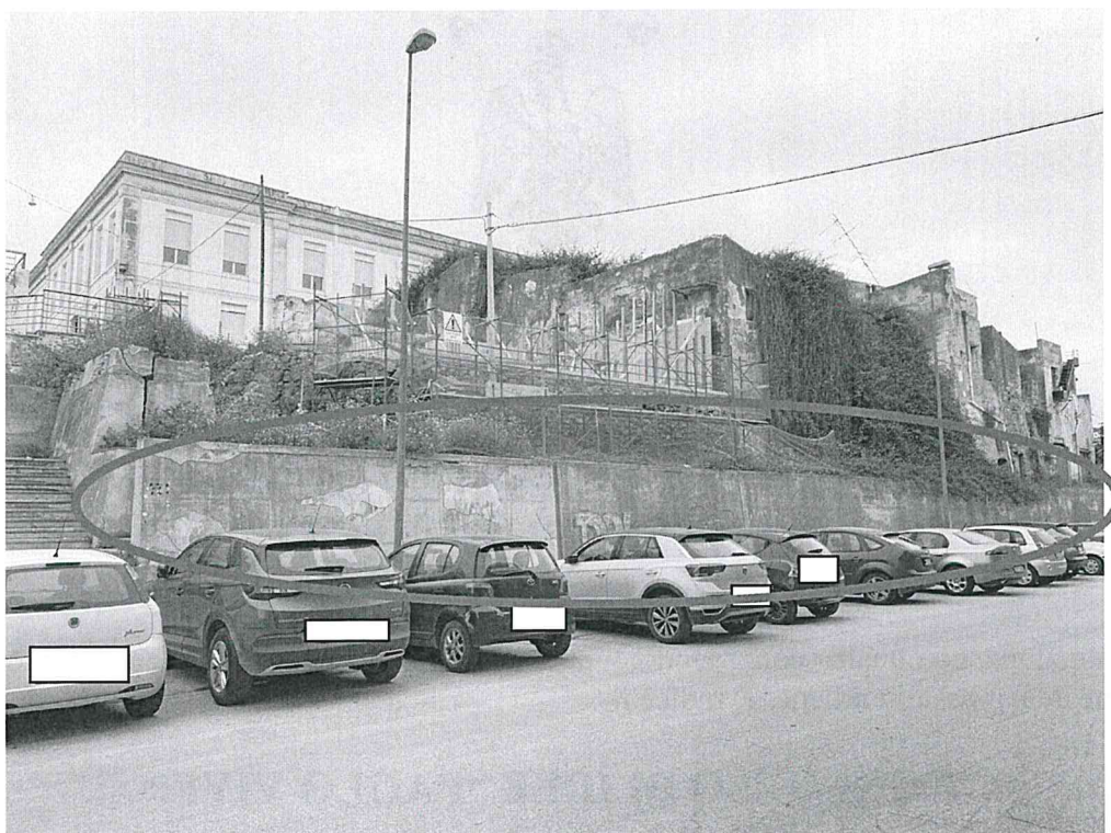
Figura 1 – Individuazione del muro oggetto del presente concorso di idee È facoltà degli artisti predisporre a propria cura il fondo del muro tramite idoneo materiale (es. vernice bianca al quarzo). Il muro verrà consegnato libero da impedimenti (es. foglie), con la finitura superficiale indicata in Figura