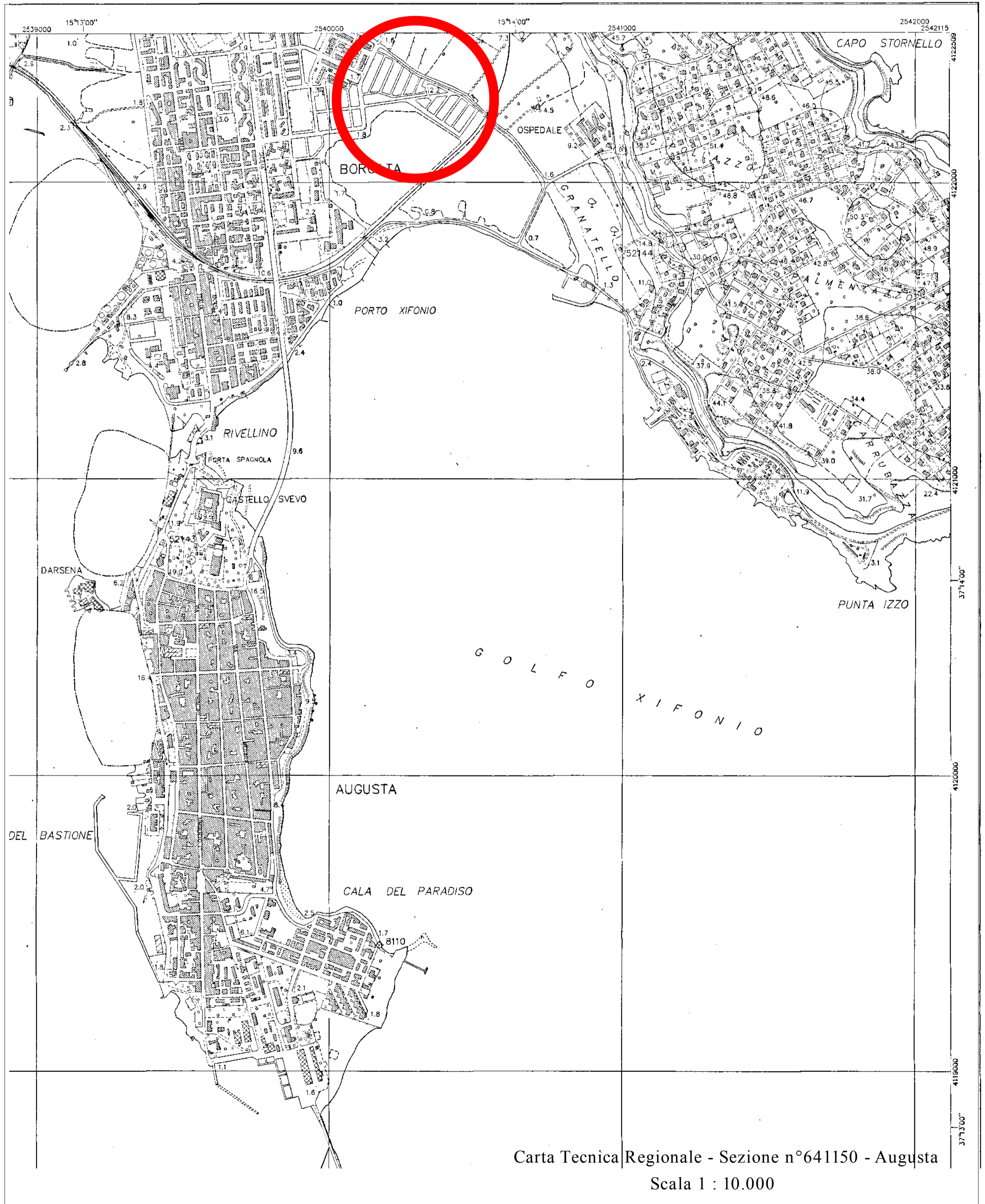
Carta Tecnica Regionale - Sezione n°641150 - Augusta Scala 1 : 10.000