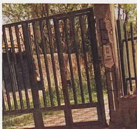
Figura 5 - Ingresso secondario Uffici comunali