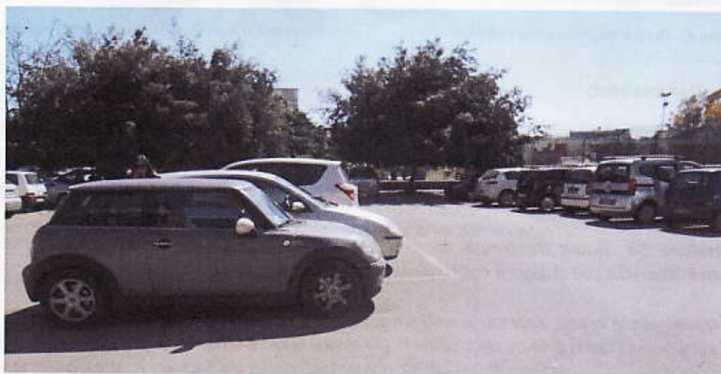
Figura 9 – Parcheggio