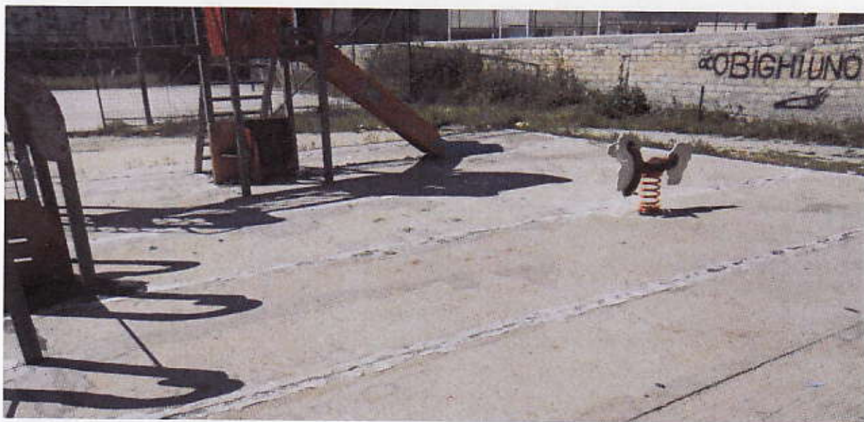
Figura 10 – Area giochi Bambinopoli

Sulla base di cemento su cui sono inseriti i giochi non è stata mai realizzata una pavimentazione di finitura e i giochi dei bambini, fatiscenti, non possono essere utilizzati. Tutto il terreno circostante risulta in stato di abbandono e in evidente stato di degrado.