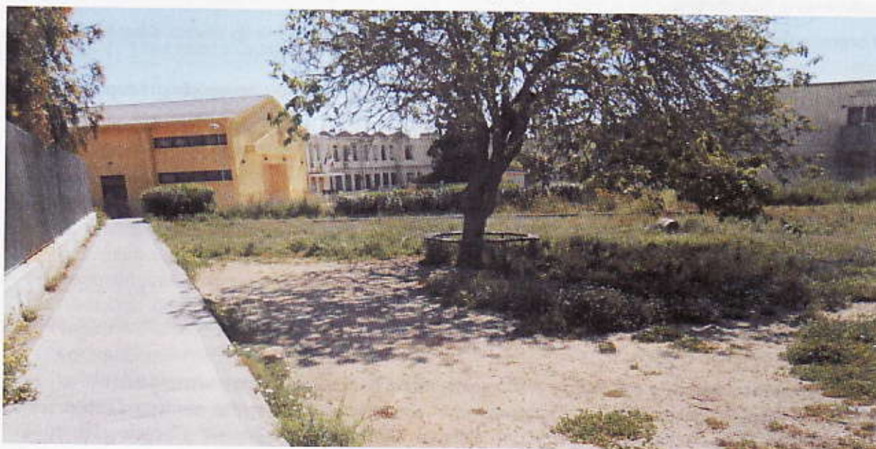
Figura 17 – Percorso pedonale esistente Campo sportivo