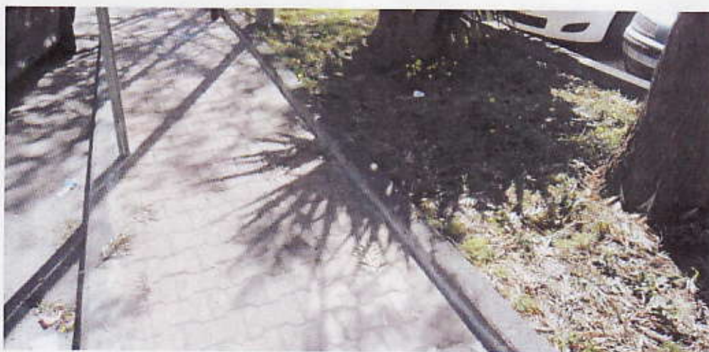
Figura 8 – Pavimentazione e oriatura Parcheggio