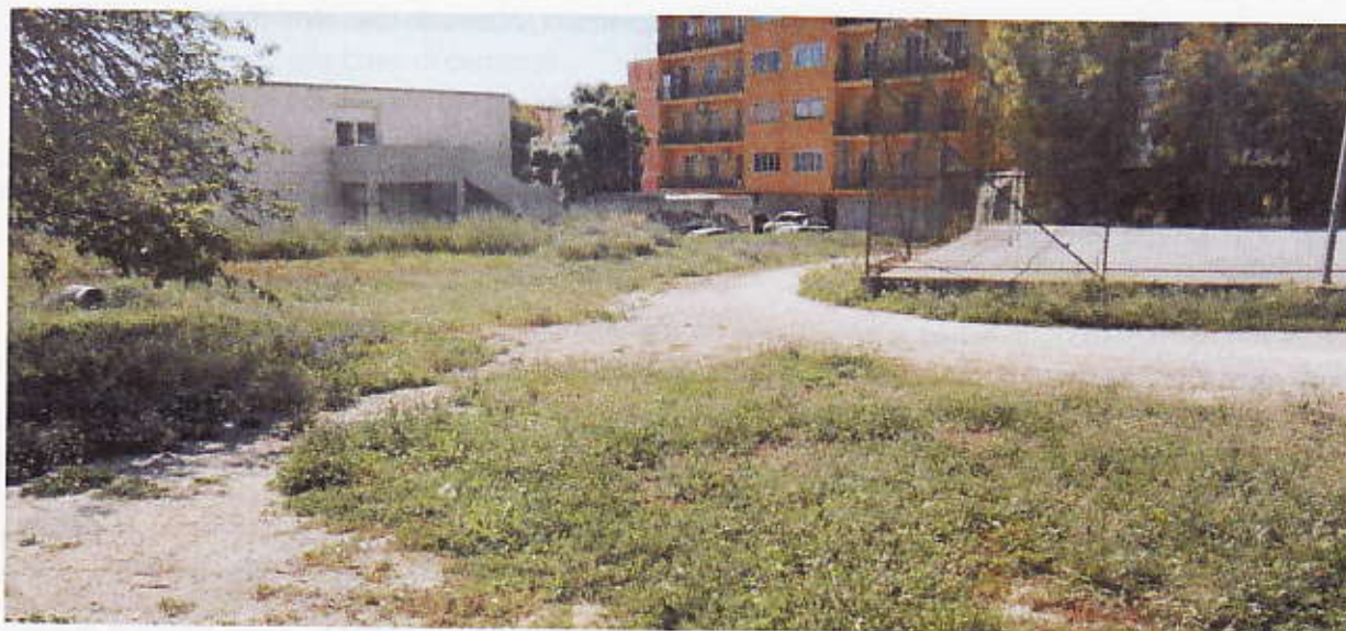
Figura 16 – Terreno Campo Sportivo