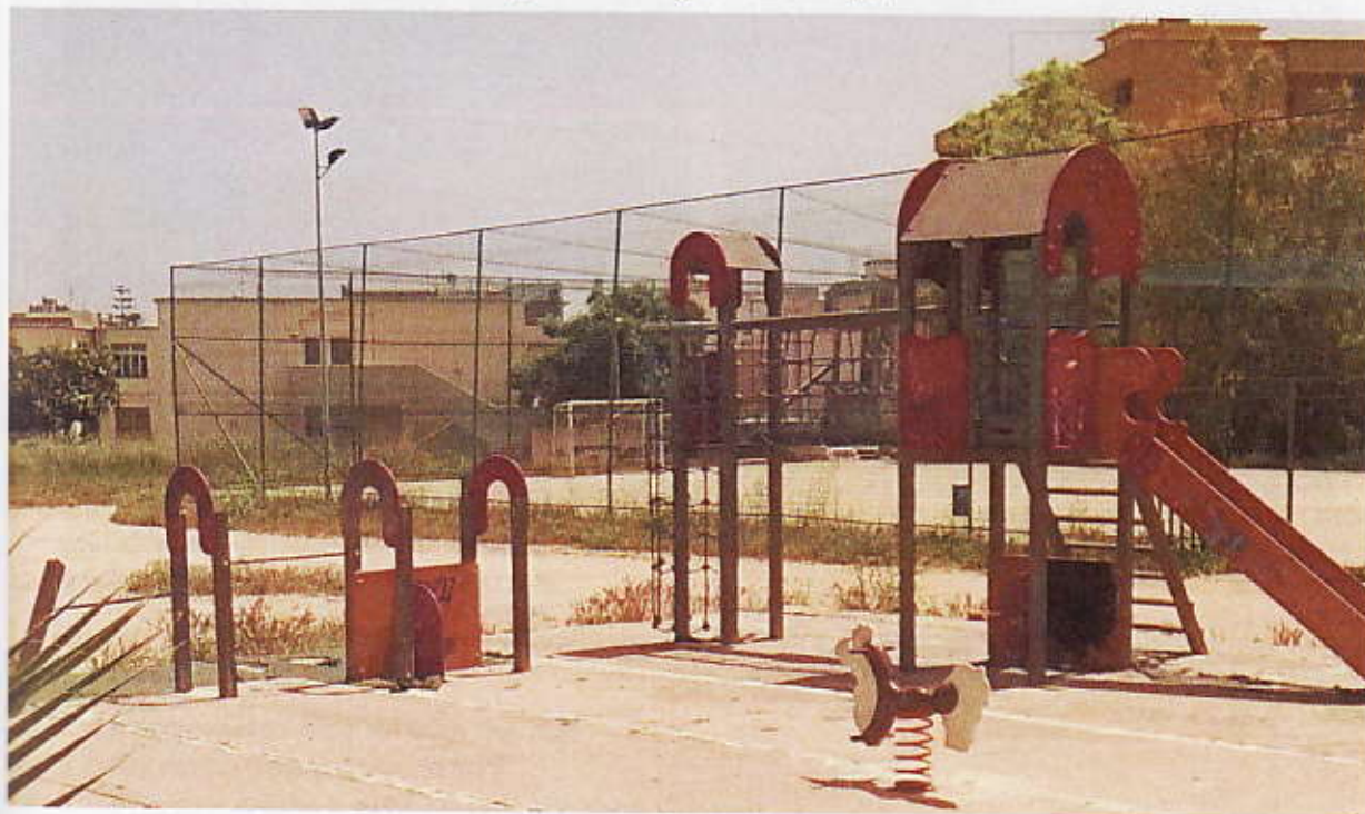
Figura 11 – Giochi esistenti Bambinopoli