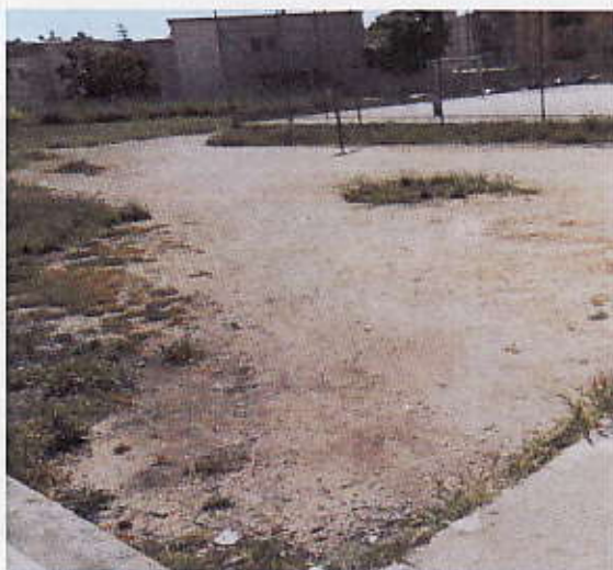
Figura 14 – Terreno Campo Sportivo

Tutto il terreno circostante risulta abbandonato e pieno di vegetazione spontanea. Lungo il muro perimetrale di via Strazzulla sono piantumati un filare di oleandri.