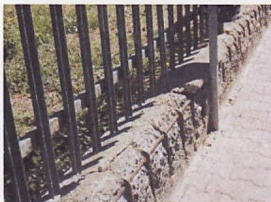
Figura 2 - Muro Uffici Comunali viale Eroi di Malta

Le ringhiere in ferro del muro di confine presentano inoltre fenomeni di formazione di ruggine.