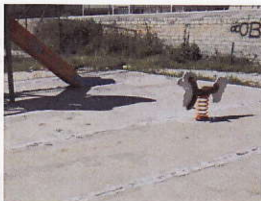
Figura 13 – Muro Bambinopoli