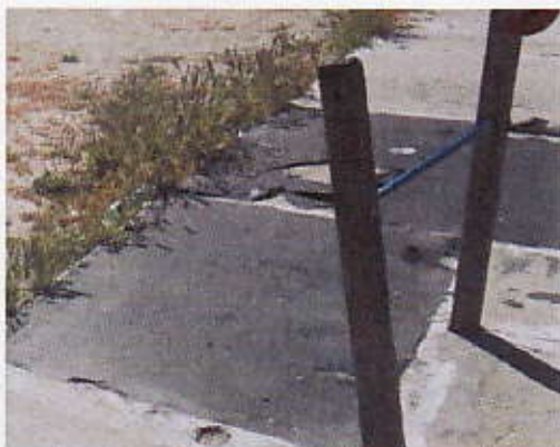
Figura 12 – Soletta esistente Bambinopoli