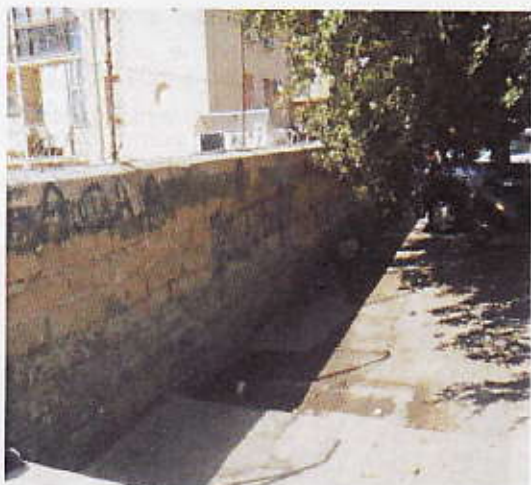
Figura 6 – muro divisione Parcheggio