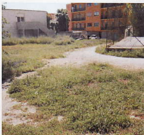
Figura 15 – Terreno Campo Sportivo