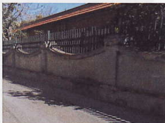
Figura 3 - Muro Uffici Comunali via Dessiè