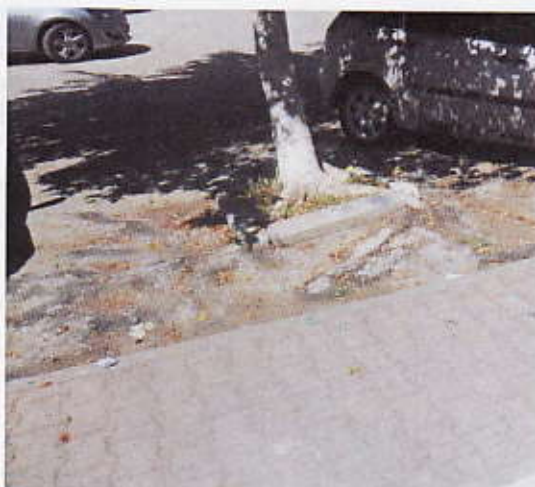
Figura 7 – Pavimentazione Parcheggio