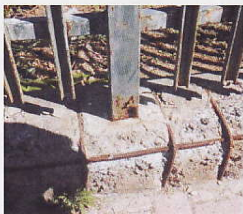
Figura 4 - Muro e ringhiera uffici comunali