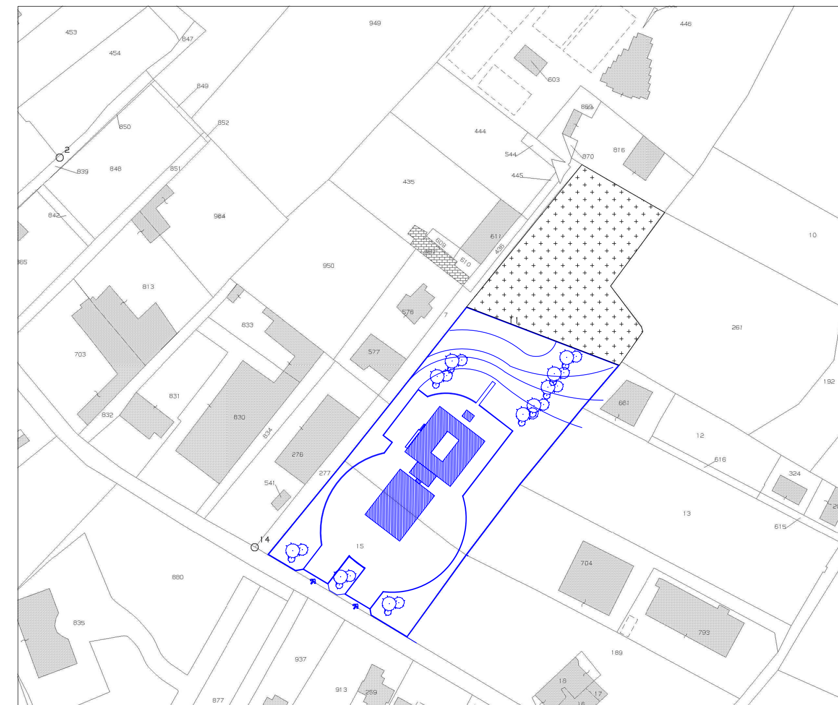
STRALCIO CATASTALE 1: 2000

Area interessata dalla fascia di rispetto e viabilità di progetto da PRG