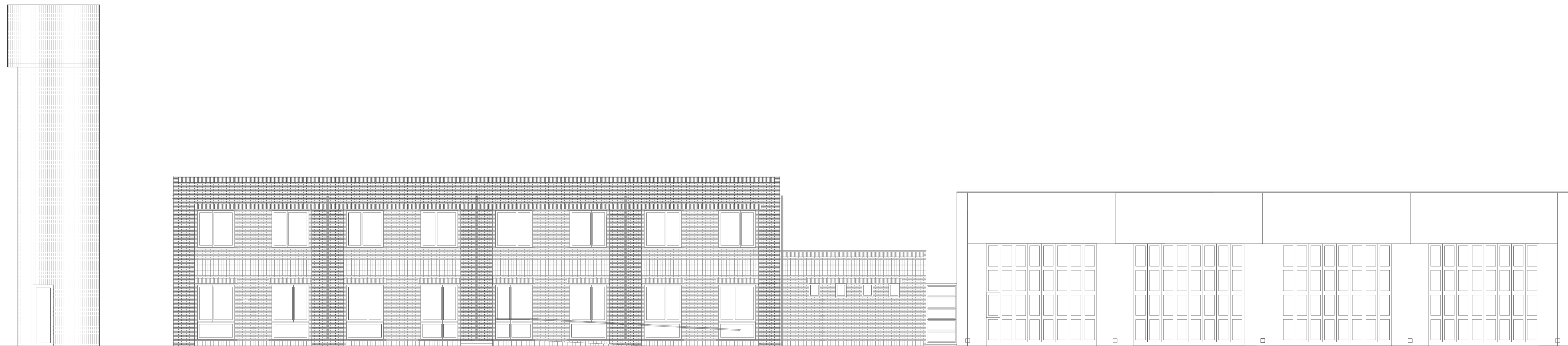
PROSPETTO NORD OVEST