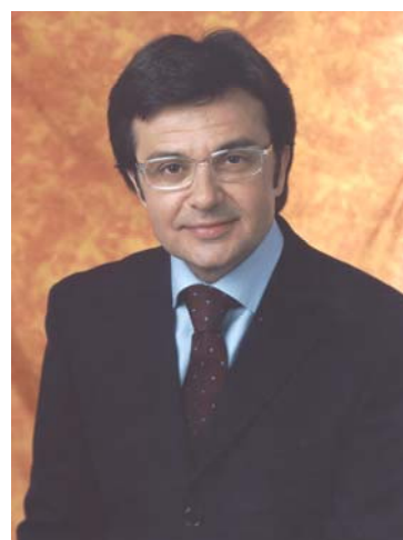
Massimo Carrubba Sindaco di Augusta